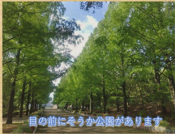
目の前にそうか公園があります

障がいのある方に対して自立支援と社会参加を目標とし、入浴・送迎・給食サービスを提供します また、年間を通して季節行事・外出行事・レクリエーションなどのプログラムを提供します