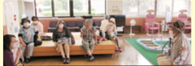
であいの森の受付がまるでホテルのようでびっくり！ゆっくり話をしながら楽しく過ごしました。また行きたいと思います。