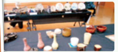
ステージ発表、展示発表の様子です