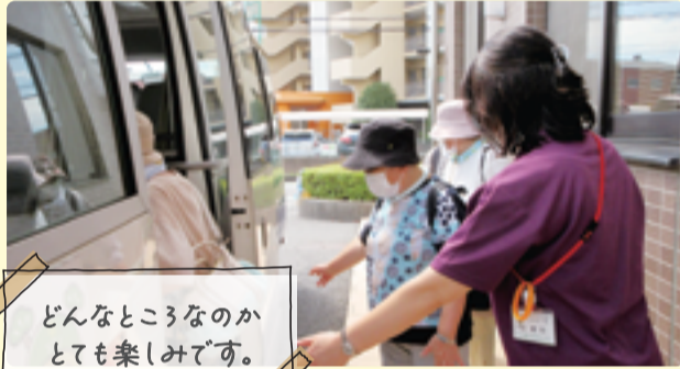
どんなところなのかとても楽しみです。

直行便を利用された高年者の方は、であいの森の雰囲気を味わい、入浴やレストランを利用されました。また、そうか公園の散歩に出かけるなど、心身のリフレッシュをすることができた様子でした。