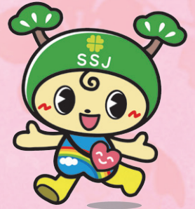
事業団イメージキャラクター 「ふくまつちゃん」